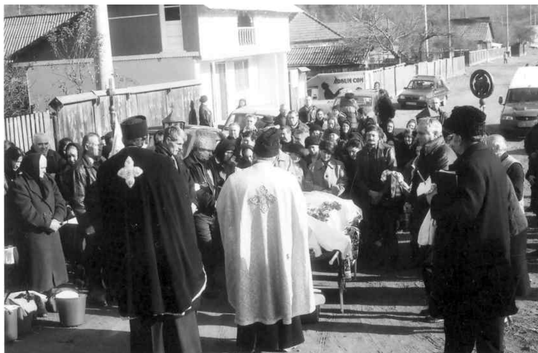
Oficierea stâlpilor