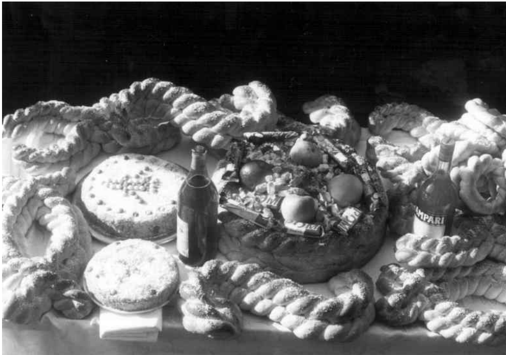
Așezarea rituală a capetelor