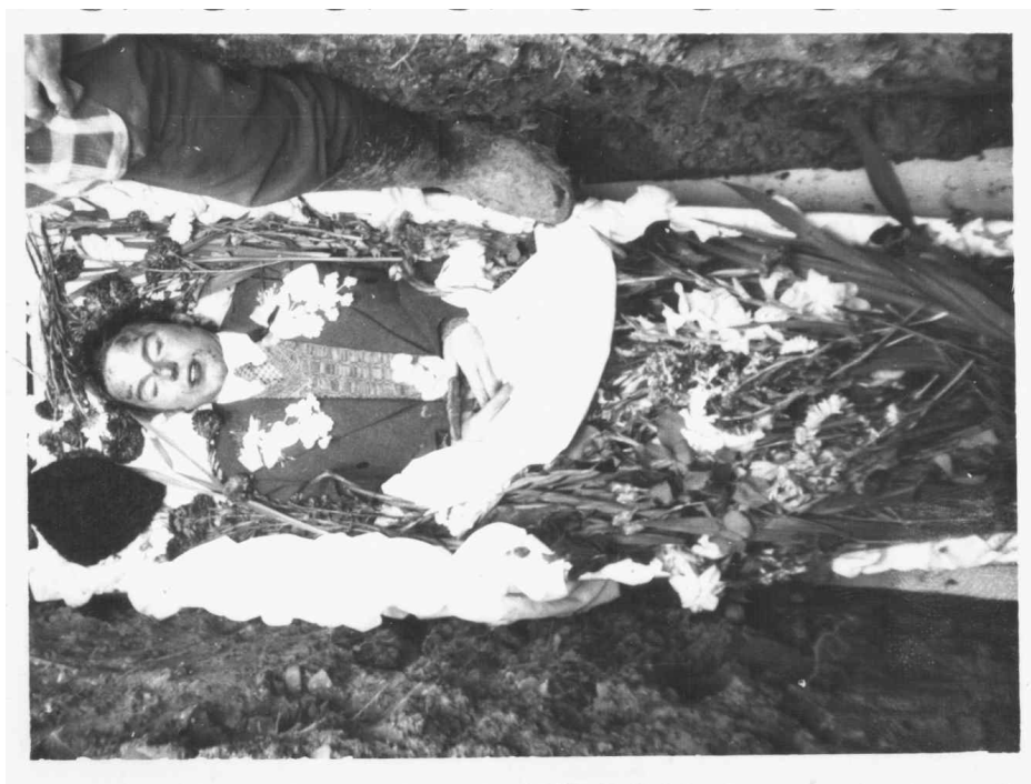
Înhumarea unui tânăr nelumit