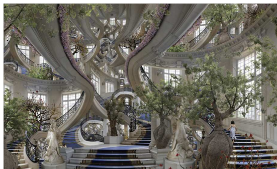
Fig. 7. Jean-Francois Rauzier, Babylons , https://www.rauzier-hyperphoto.com/en/project-type/creations/

Trompe-l'oeil -ul hiperfotografiei rescrie o nouă raportare la timp. Punctum hiperfotografiei, rămâne deictic, însă, în raport cu un timp absolut, cu un timp delegat într-o circularitate hermetică. „Zeul nu cunoaște granițe spațiale și poate să fie, în diferite forme, în locuri diferite în același moment”, nota Umberto Eco despre hermetism (Eco 2016: 42). Analog, referința hiperfotografiei, derivată în trompe-l'oeil , intensifică, nu numai imaginea, ci și raportul cu timpul. ‘ Acest–lucru-a–existat–cândva ’, intensificat, duplicat infinit în „geamănul fantomatic”, trimite la un timp redundant, infinit, spațiat, un fel de „diferență” continuă, care nu mai permite definiția niciunui moment post-factual.