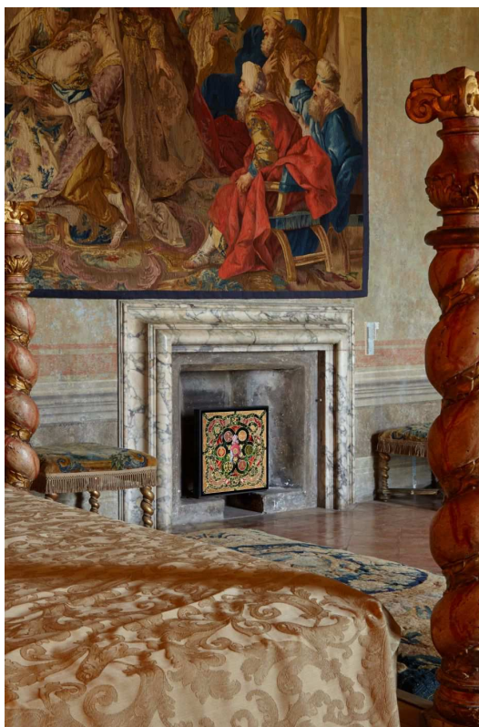
Fig. 2. Ileana Florescu, Le stanze del Giardino , Villa Medici, Roma, 2018

Ileana Florescu plasează chiar în spațiul edificiului o serie de hiperfotografii în care „natura opulentă, narațiunea istorică și fantezia, personaje ilustre și intrigi de curte” 10 își pierd marginile în cadrul unor arabescuri cu desene florale. Acestea pun în abis o imagine autoreferențială a Villei Medicilor și deschid o amplă interogație asupra artei și reprezentării.