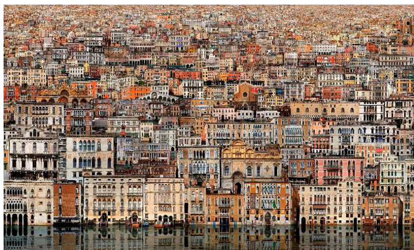
Fig. 8. Jean-Francois Rauzier, Venice Veduta , https://www.rauzier-hyperphoto.com/en/project-type/creations/

Decupată într-un hiper-timp, prezent și continuu, hiperfotografia este concomitent referința și „geamăul său”, dublul, punctul de „disociere întortocheată a conștiinței identității” și „începutul existenței mele ca altul” (Barthes 2010: 18).